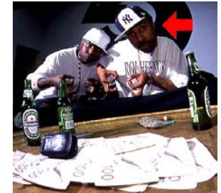
Gaël noir et son pote le roi

Gaël a fait la connaissance du Roi Heenok et est devenu son meilleur ami. Maintenant il est noir, il a un médaillon qui lui touche le pénis et l'hydroponique qu'il aspire à longueur de temps lui empêche de copuler. Devenu impuissant à cause de la drogue, Gaël se morfond et attend d'être reconnu par le rap français pour revenir au pays.