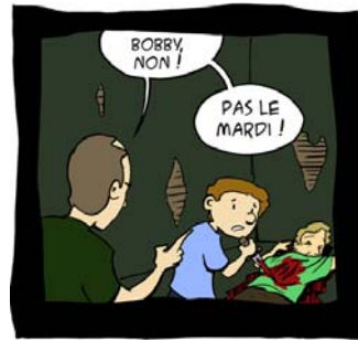
Etre un bon parent, c'est savoir fixer les limites.

Par exemple, Bobby n'a plus le droit de poignarder des gens le mardi.