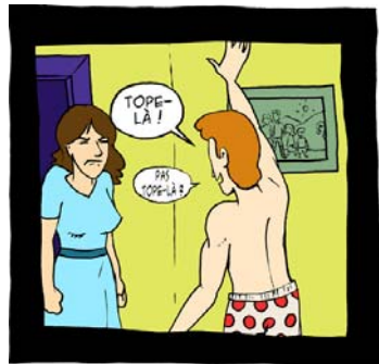
Apparemment, "tu es au lit avec une autre fille!" n'était pas un compliment de sa part.