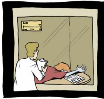
Une fois de plus, l'expérience fut un échec.