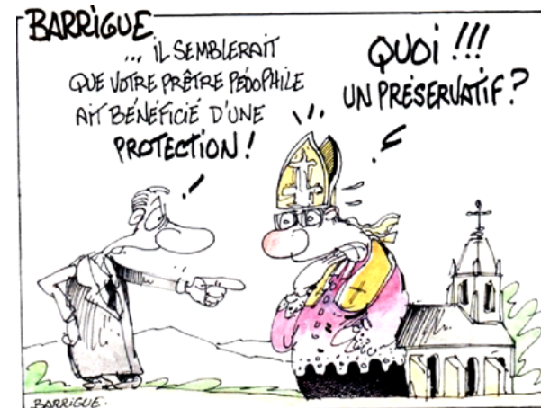
BARRIGUE ... IL SEMBLERAIT QUE VOTRE PRÊTRE PÉDOPHILE AIT BÉNÉFICIÉ D'UNE PROTECTION! QUOI!!! UN PRÉSERVATIF? PRÊTRE PÉDOPHILE Le silence coupable de l'Eglise.

Sinon on a découvert pourquoi les prêtres avaient des relations sexuelles avec des mini-pouces :