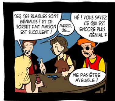
Le gros avantage du handicap, c'est qu'on peut plomber n'importe quelle conversation n'importe quand pendant au moins cinq minutes.